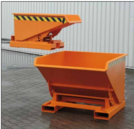
Typ EXPO 150 und Typ EXPO 600