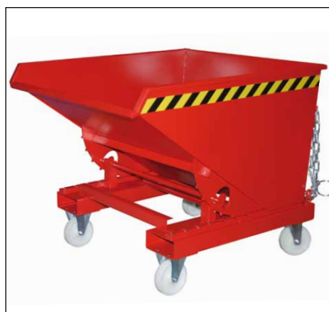
Typ EXPO mit Rollen (Zubehör)