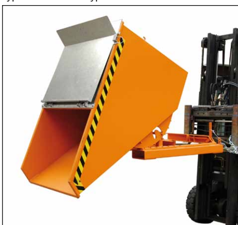
Typ EXPO mit Deckel (Zubehör)