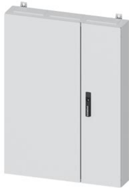
ALPHA 160 DIN Wandverteiler Aufputz mit Verteilerfeld, IP44, Schutzklasse 2 H=1100mm, B=800mm, T=140mm RAL 9016