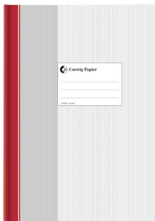
Livre de compte, format A4