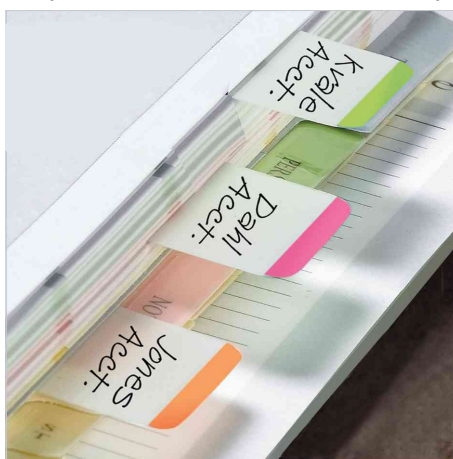
Visuel de référence: montre le produit en application