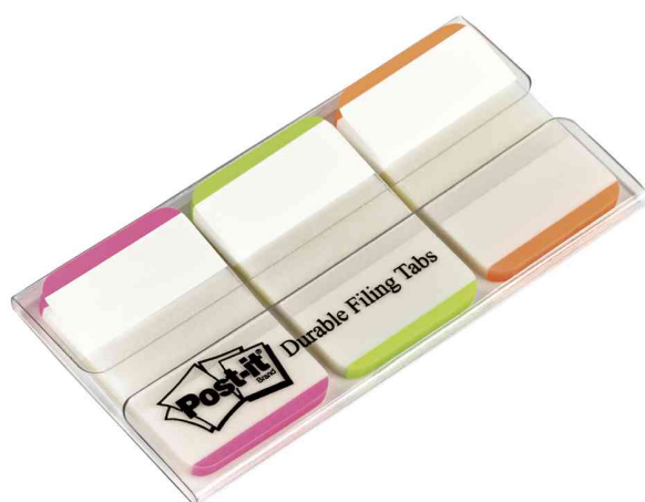
Languelette de classement Index Strong, rose/vert/orange