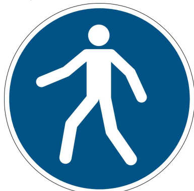
emprunter le chemin piéton