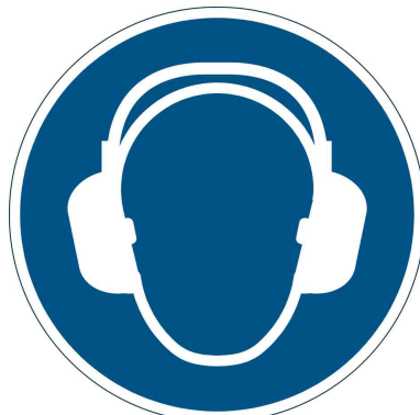
porter un casque anti-bruit