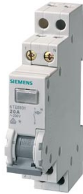
Kontrollschalter 20A 3S 1 Lampe 230V