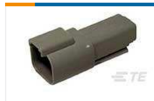
TE Teilnr.:DT04-2P REC, 2P, GRY, N