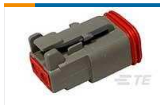
TE Teilnr.:DT06-2S PLG, 2P, GRY, N