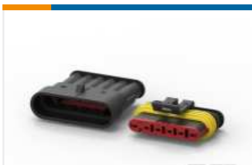
TE Teilnr.:282104-1 AMP SUPERSEAL 1.5MM, STECKVERBINDERGEHÄUSE