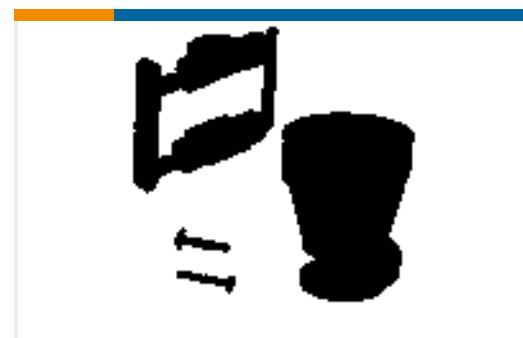
TE Teilnr.:206070-8 CABLE CLAMP KIT #17