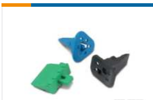
TE Teilnr.:W2S DEUTSCH DT Keilschlösser