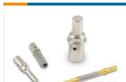
TE Teilnr.:0460-202-16141 DEUTSCH Kontakte