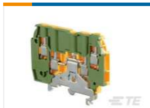
TE Teilnr.:1SNA195638R2300 M4/6.4A.P