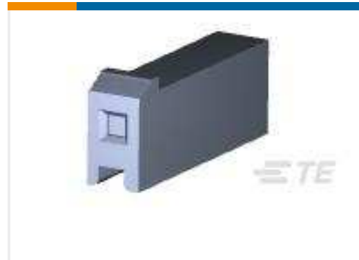
TE Teilnr.:640250-1 01P SL156 HSG W/LCK RAMP NATL