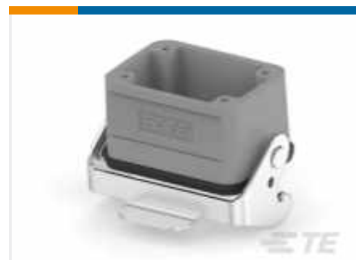
TE Teilnr.:T1730060000-000 H6B-TBF-T