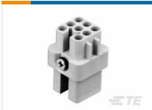
TE Teilnr.:T2020082201-000 HD-008-F