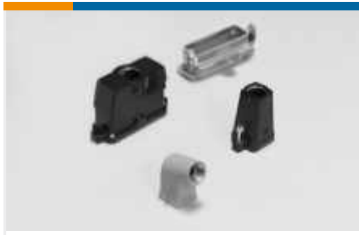
Hauben und Basis für rechteckige Steckverbinder(445)