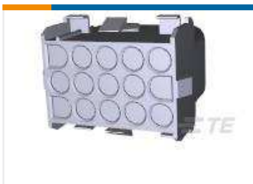
TE Teilnr.:1-480711-9 15P UMNL CAP HSG BLK