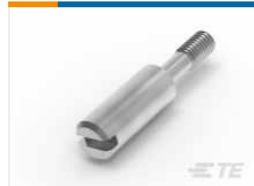
TE Teilnr.:T0931003003-000 CODING-PIN-M3