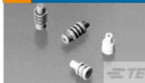
TE Teilenummer 1-178210-3 NEW RUBBER PLUG SMALL WIRE