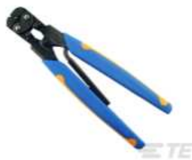
TE Teilenummer 525693 22-10 TYPE W D.A.H.T. ASSY