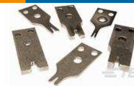
TE Teilenummer 2-456135-0 CRIMPER, INSULATION "O" (.110)