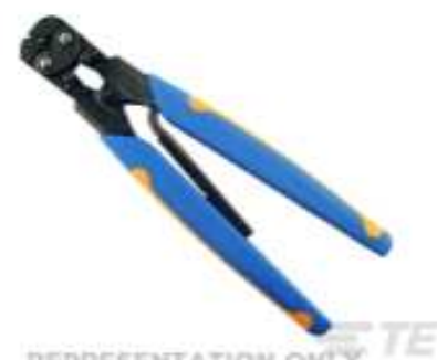
TE Teilenummer 574573 22-10 1-9 W TYPE D.A.H.T. ASSY