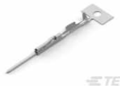
TE Teilenummer 2236905-1 NANO TAB 0.5X0.4, TERMINAL