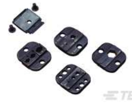
TE Teilenummer 58545-3 SDE DIE ASSY. 22-10 SOLISTRAND