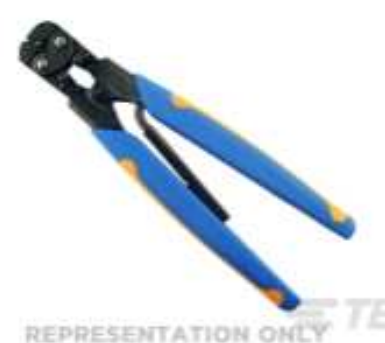
TE Teilenummer 49935 DAHT SOLIS 22-10