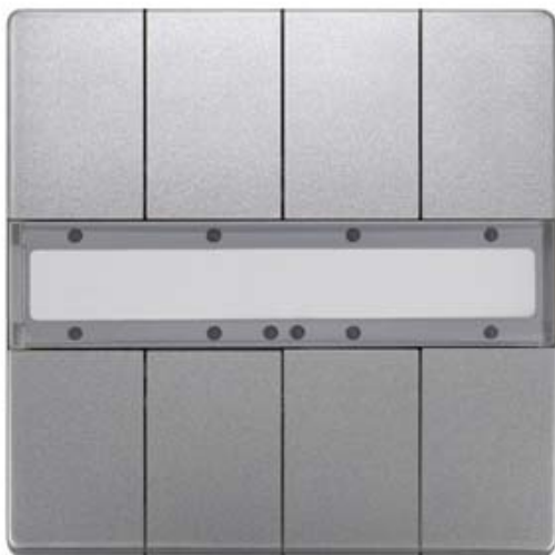
GAMMA INSTABUS TASTER 4-FACH UP 287/2 DELTA STYLE PLATINMETALLIC