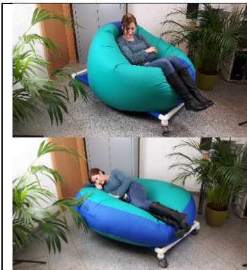
UGF 502 (150 cm lg.) m. MALTA 150 cm Durchmesser