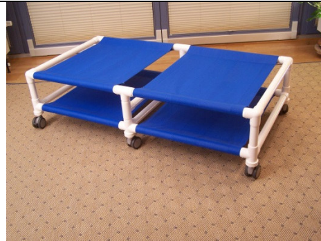
UGH Fahrgestell hohe Ausführung