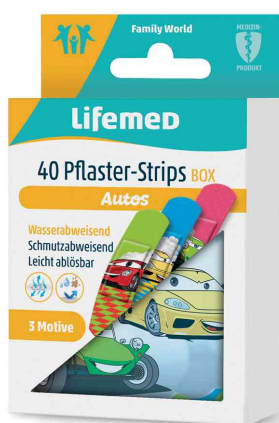
Pansement pour enfants "Voitures"