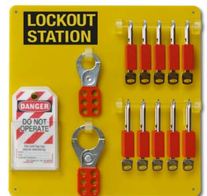
Sammelstation Typ 10, H 34,2 x B 34,2 cm, Bestell-Nr. 209-712-J9