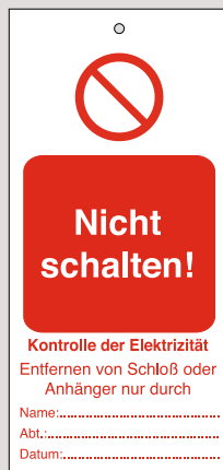
Anhänger, Bestell-Nr. 209-706-J9