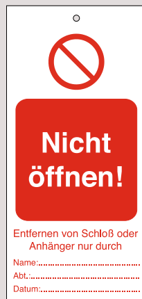
Anhänger, Bestell-Nr. 209-704-J9