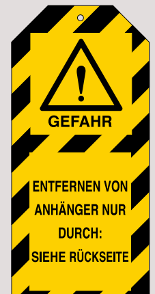
Anhänger, Bestell-Nr. 209-707-J9