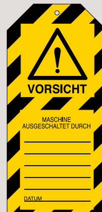
Anhänger, Bestell-Nr. 209-705-J9