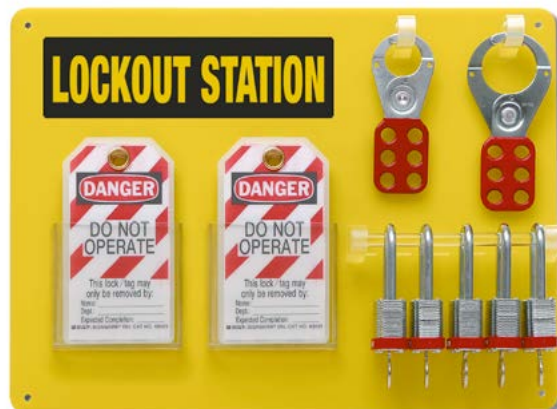
Sammelstation Typ 5, H 29,2 x B 39,3 cm, Bestell-Nr. 209-713-J9

Diese sehr gut sichtbaren Sammelstationen aus hochwertigem Polykarbonmaterial bringen Ordnung und Übersicht in Ihr Schließsystem. So sind alle bei Ihnen vorhandenen Verschluss-Systeme übersichtlich sortiert und schnell zu nutzen. Die Sammelstationen können mit Schlössern, Schließbügeln oder Anhängern für Warnhinweise befüllt werden, im Lieferumfang sind keine Schlösser etc. enthalten.