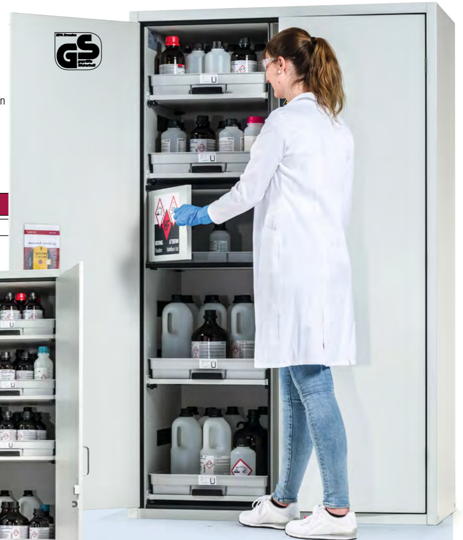
Übersichtliche, getrennte Lagerung von Gefahrstoffen