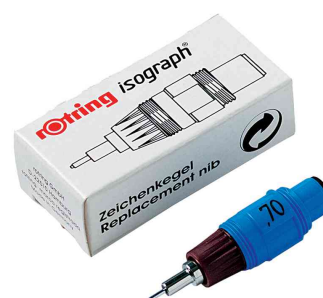
Visuel de référence: Pointe de rechange pour stylo