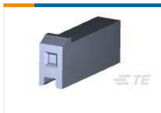
TE Teilnr.:640250-1 01P SL156 HSG W/LCK RAMP NATL