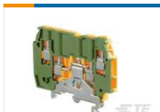
TE Teilnr.:1SNA195638R2300 M4/6.4A.P