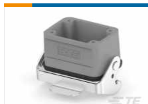
TE Teilnr.:T1730060000-000 H6B-TBF-T