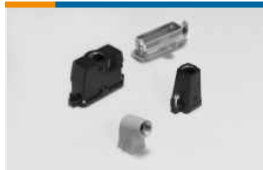
Hauben und Basis für rechteckige Steckverbinder(445)