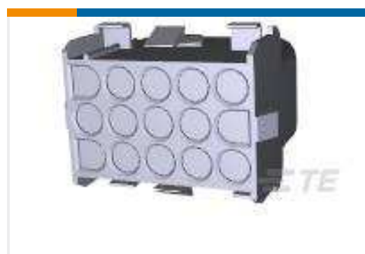
TE Teilnr.:1-480711-9 15P UMNL CAP HSG BLK