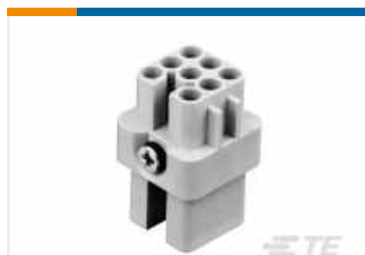
TE Teilnr.:T2020082201-000 HD-008-F