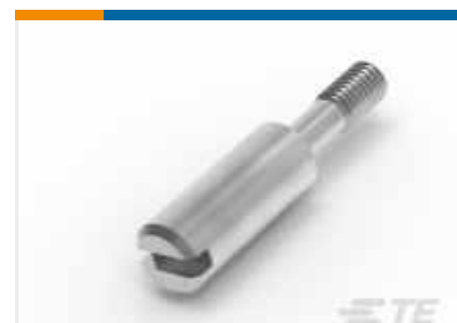
TE Teilnr.:T0931003003-000 CODING-PIN-M3