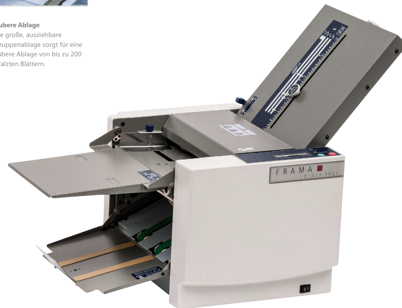
Frama Folder P850-S

Frama Folder P850-S. Einfach komfortabel.