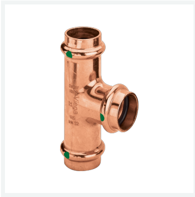
Profipress-T-Stück mit SC-Contur Modell 2418 Artikel 291 938