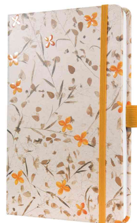
Carnet de notes Jolie Beauty "Bloom Yellow"