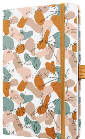
Carnet de notes Jolie Beauty "Autumn Linear Leaves"