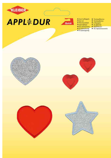
Assortiment d'applications "Lovely Hearts"

Veillez respecter les consignes d'entretien et celles du vêtement. Les indications se réfèrent aux applications.