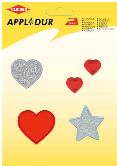
Applikations-Sortiment "Lovely Hearts"

Bitte beachten Sie die Pflegehinweise und die des Kleidungsstückes. Die Angaben beziehen sich auf die Applikationen.