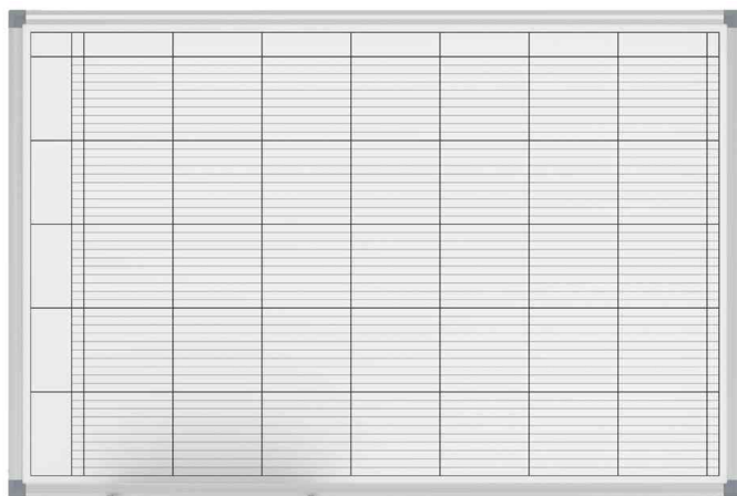
Tableau de planning universel MAULstandard