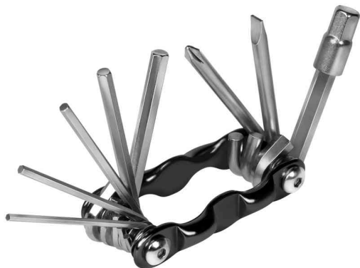
Outil multifonctions pour vélo, 9 pièces