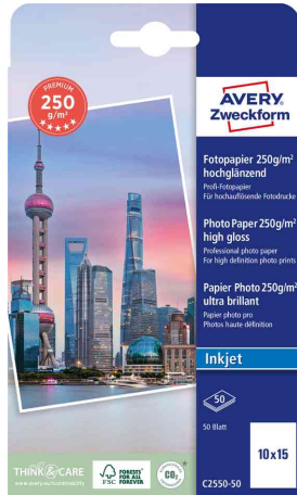
hochglänzend, 50 Blatt