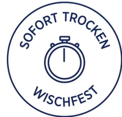
Sofort Trocken und wischfest