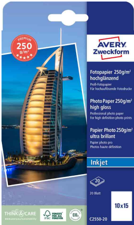
hochglänzend, 20 Blatt