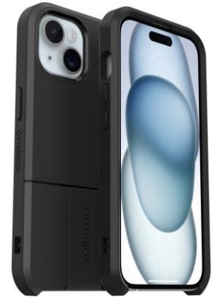
Black 77-92676 (ProPack) 840304730674