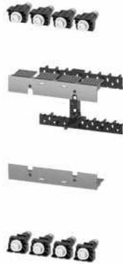
Steckeinheit Umrüstbausatz für MCCB Zubehör für: Leistungsschalter, 4-polig 3VA12