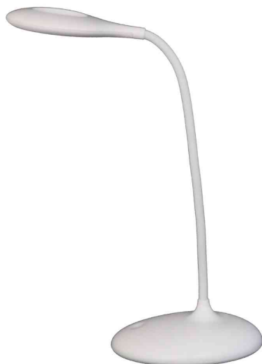
Lampe de bureau à LED sans fil GALY 1200

- cette lampe vous accompagne partout - que ce soit à votre bureau, dans une salle de réunion ou une chambre d'hôtel