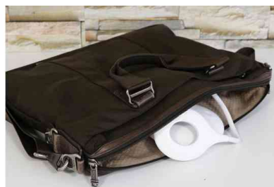
Visuel de référence : présente la lampe enroulée pour gagner de la place