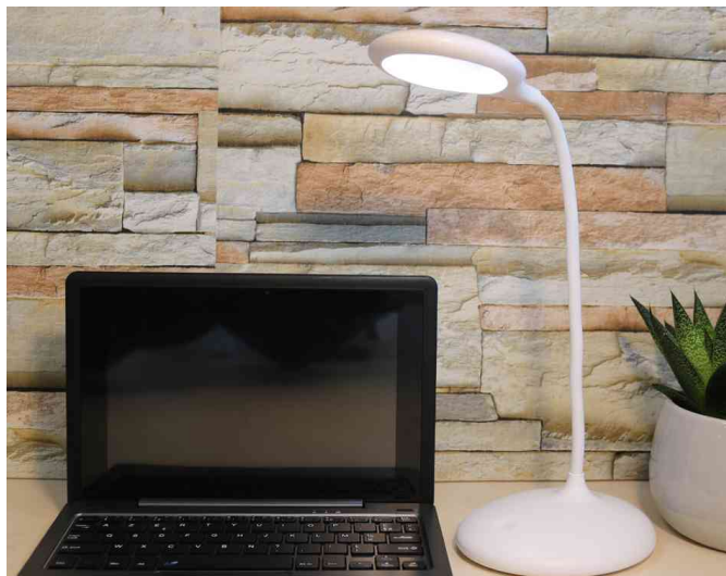
Visuel de référence : présente le produit en utilisation