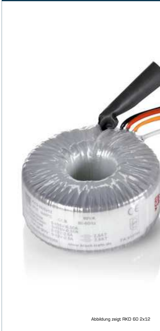
Abbildung zeigt RKD 60 2x12