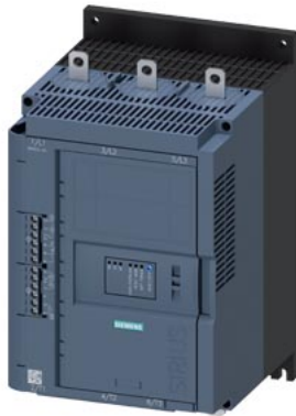
SIRIUS Sanftstarter 200-480 V 143 A, AC/DC 24 V Schraubklemmen Thermistoreingang