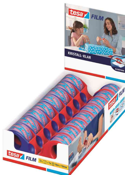
Mini dévidoir, dans un présentoir de comptoir

- le mandrin ouvert permet le port au doigt et l'utilisation libre des deux mains