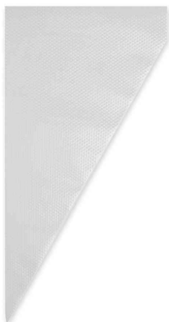
Poche à douille en HDPE, gaufré