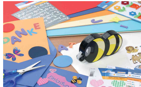
Kleberoller "Klebebiene", Anwendung