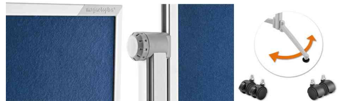
Detailansichten: Rahmenprofil - Drehknopf - Laufrollen