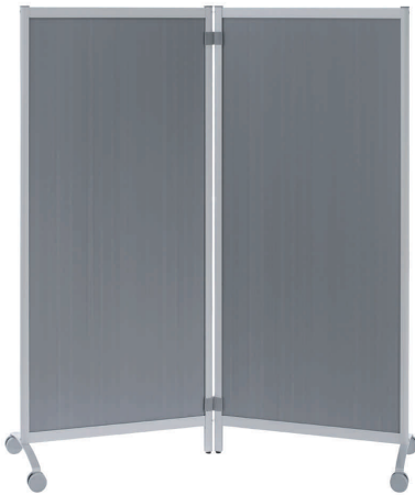
Mobiles Trennwandsystem, 2er Set, alu-grau