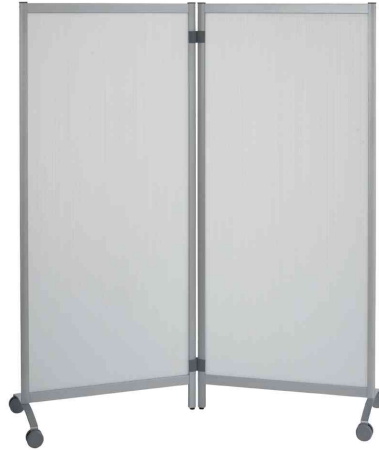
Mobiles Trennwandsystem, 2er Set, transparent