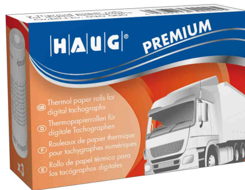
Rouleau de papier thermique HAUG PREMIUM, emballage