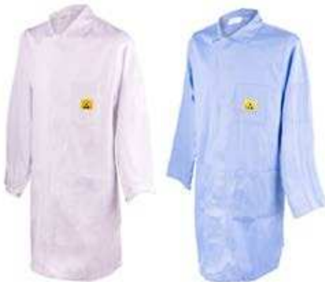
Ärmel mit Druckknopf / tailliert

Ableitfähige/Antistatische Eigenschaften nach folgenden Normen: PN-EN 61340-5-1, PN-EN 1149-5 : 2009