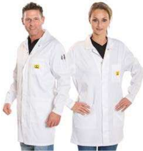
Ärmel mit Druckknopf / unisex