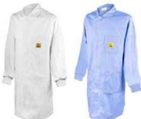
Ärmel mit Bund / unisex