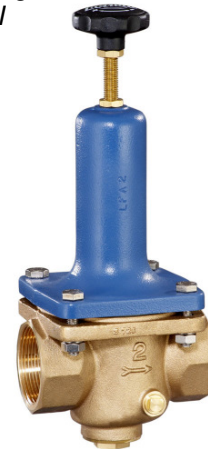
DN 32 - DN 50