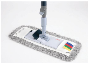
CombiSpeed Pro – 40 und 50 cm breite Taschen- und Laschenmopbezüge.