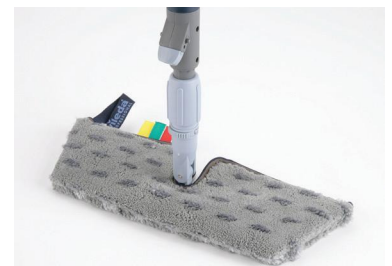
Swep – Marktführendes System für vorpräpariertes Reinigen.