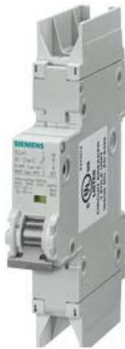
LEITUNGSSCHUTZSCHALTER 10KA, 1-POLIG, C, 16A NACH UL 489 - 277V