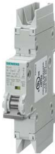
LEITUNGSSCHUTZSCHALTER 10KA, 1-POLIG, C, 40A NACH UL 489 - 277V