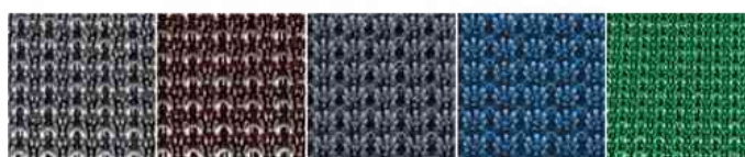
gris clair - marron - anthracite - bleu métal - vert