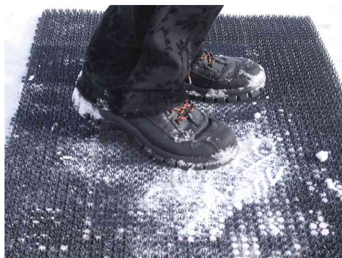
Visuel de référence: exemple d'utilisation