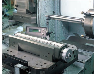
Használat vízszintes elrendezésben