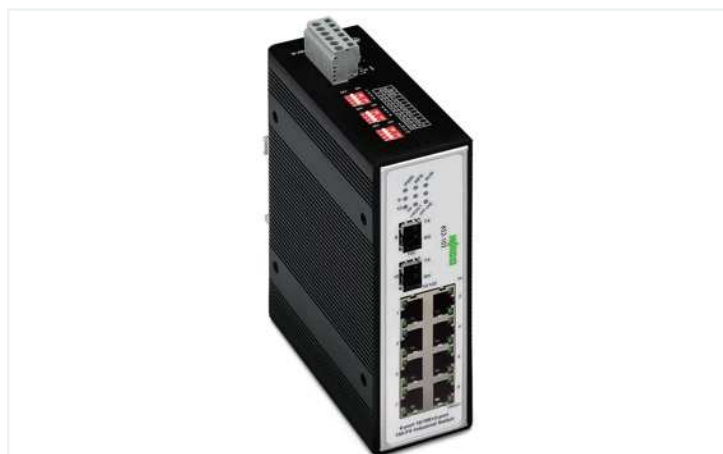
Farbe: ■ schwarz