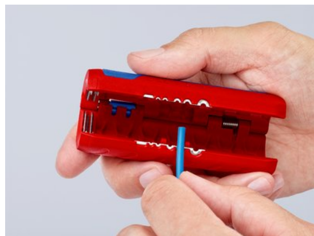
90 22 02 SB: Eingespritzte Längenskala für gleichmäßiges Abisolieren auf eine einheitliche Länge, lesbar für Rechts- und Linkshänder