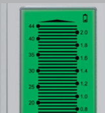
Großes, übersichtliches LC-Display