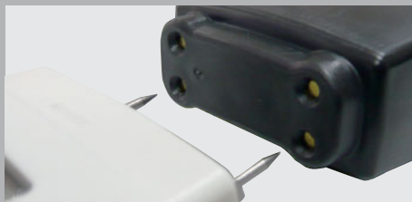
Schutzkappe mit Selbsttest-Funktion