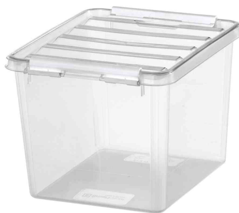
Aufbewahrungsbox CLASSIC 3, weiße Klippverschlüsse