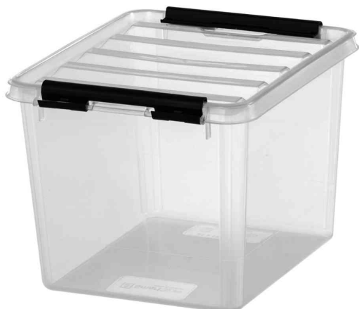
Aufbewahrungsbox CLASSIC 3, schwarze Klippverschlüsse

- Haushalte, Betriebsorganisationen, Kindergärten, Camper, Bauarbeiter, Gastronomie