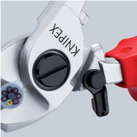
95 26 165: El trinquete bloquea las hojas con el muelle de apertura situado en el interior

Efecto de corte con un cortacables: corte fácil, limpio, sin deformaciones