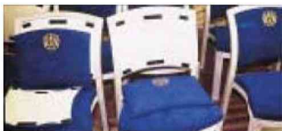
Dual Lock, exemples d'application