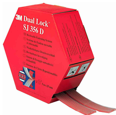
Fermeture velcro Dual Lock flexible SJ356D