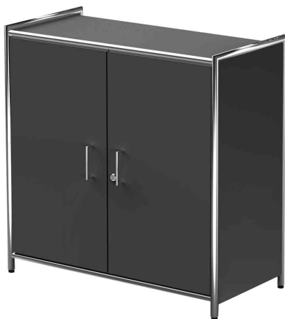
Bahut ARTLINE, 2 compartiments, anthracite

- rangement de classeurs, livres et catalogues