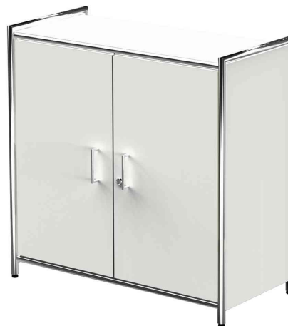
Bahut ARTLINE, 2 compartiments, blanc