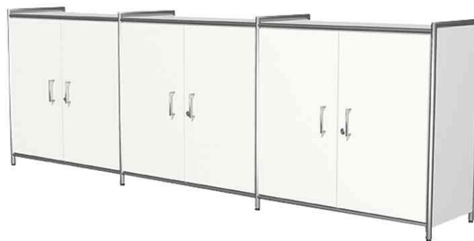
Bahut ARTLINE, 6 compartiments, blanc