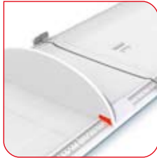
Auf der großen Skala lässt sich der Messwert schnell ablesen.

Das zweigeteilte Messbrett seca 417 wird über ein Scharnier aufgeklappt. Es verfügt über einen integrierten Kopfanschlag und einen separaten Fußanschlag, der auf einer sanft erhöhten Führungsschiene leicht und präzise bewegt werden kann. Zum Messen genügt es, den Kopf des Kindes am Kopfanschlag auszurichten, die Beine vorsichtig zu strecken und den Fußanschlag an die Füße zu führen.