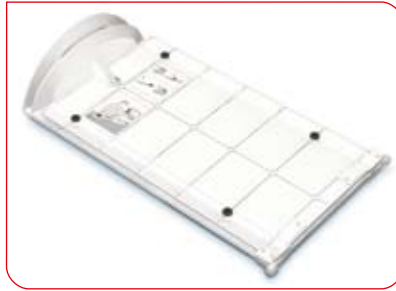
Der hochwertige Klappmechanismus garantiert eine lange Lebensdauer.

Das Stadiometer seca 417 ist ideal für den mobilen Einsatz, um den Ernährungs- und Entwicklungsstand von Säuglingen und Kleinkindern z.B. bei Reihenuntersuchungen zu überprüfen. Denn gerade hier ist es wichtig, dass die Messergebnisse leicht und schnell abgelesen werden können. Das gewährleisten rote Ablesemarken und eine hochwertige Skalenbedruckung, die auch nach Jahren intensiven Gebrauchs nicht verblasst.